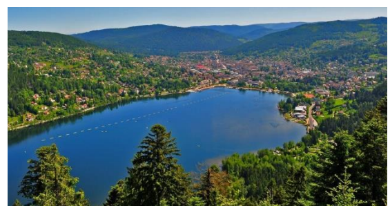
See von Gérardmer

Die letzte Etappe führt uns nach Granges-sur-Vologne, danach an den Seen von Gérardmer und Xonrupt-Longemer vorbei. Nun nochmals (diesmal von der anderen Seite her) über den Col de la Schlucht zur Tankstelle in Munster und dann auf direktem Weg ins Hotel. Das Bier haben wir uns dann verdient.